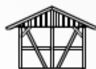
Grundmodell mit Rückwand